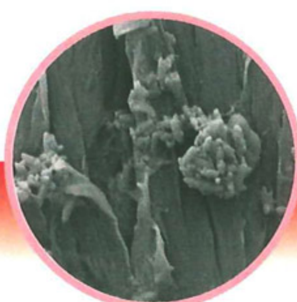
benutzte normale Zahnbürste