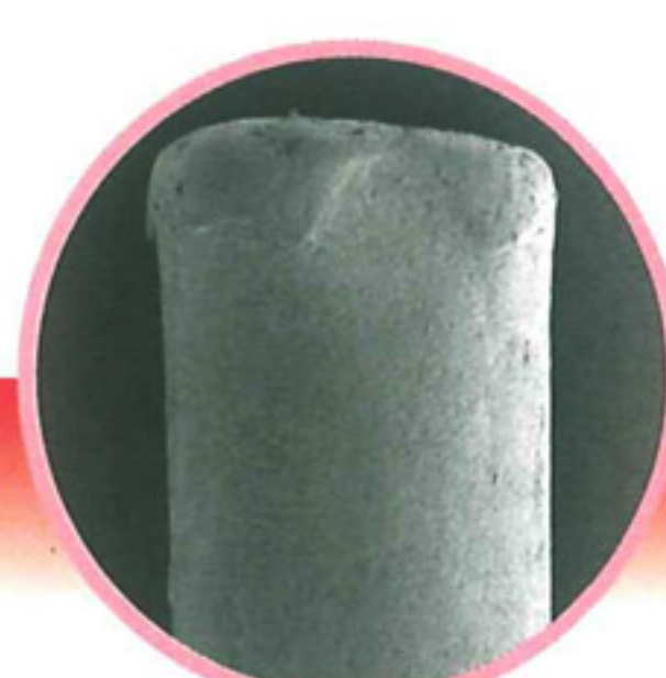
Ultraschallbürste 10 Wochen benutzt